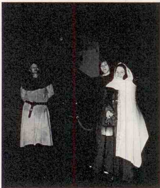
Josef a Marie v podání blatenských Mladých hasičů