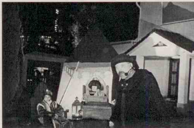
Tři králové a taktéž blatenští Mladí hasiči

školek a jde jim to náramně. Občas některé německé bejby sice zapomenou text, ale vyrovná to svou roztomilostí v kostýmku miniaturního andílka, a tak jsou návštěvníci spokojeni, po představení popíjejí punč či svažené víno, nakupují řemeslné výrobky či výtvary mateřských či základních škol, anebo se jen tak nechávají unést příjemnou sváteční atmosférou. Déšť alespoň občas na chvilku polevuje.