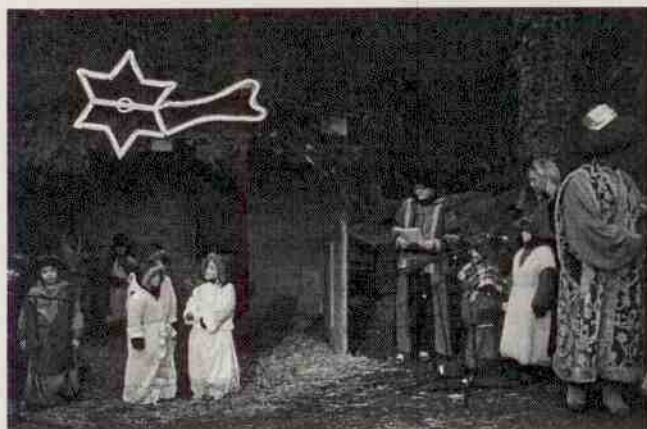
Děti z MŠ ve Weinbachu

Je pátek, šest hodin ráno, mlha by se dala krájet, u hasičské zbrojnice je nebývale živo. Rodiče blatenských Mladých hasičů vypravují své děti na dalekou cestu.