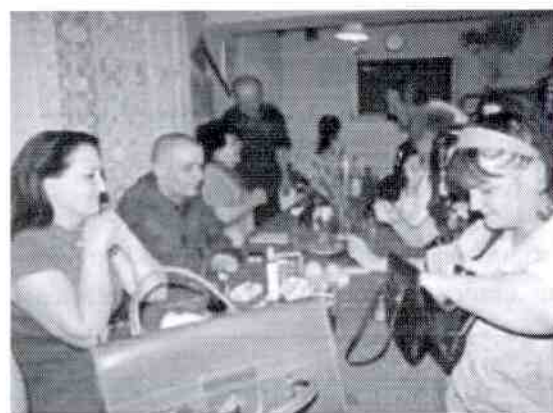
Text a foto Jaroslav Zocher